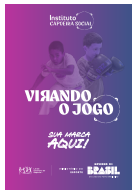
FAIXA DE 4M X 0,70M