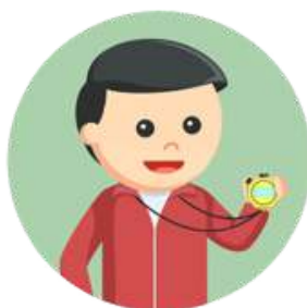
1 (UM) COORDENADOR TÉCNICO