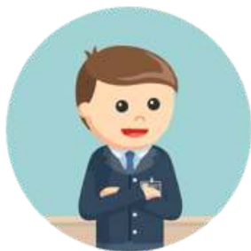
1 (UM) SUPERVISOR ESPORTIVO

As atividades serão desenvolvidas em dois núcleos na cidade de Porto Alegre. Ao todo serão 06 (seis) turmas de 20 alunas cada, totalizando 120 meninas dos 10 aos 17 anos, que terão atividades duas vezes por semana.