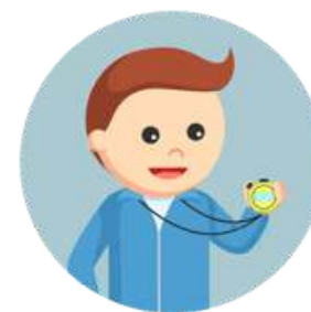
2 (DOIS) PROFESSORES DE EDUCAÇÃO FÍSICA